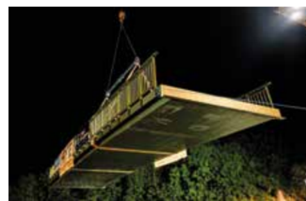
Brug wordt ingehesen