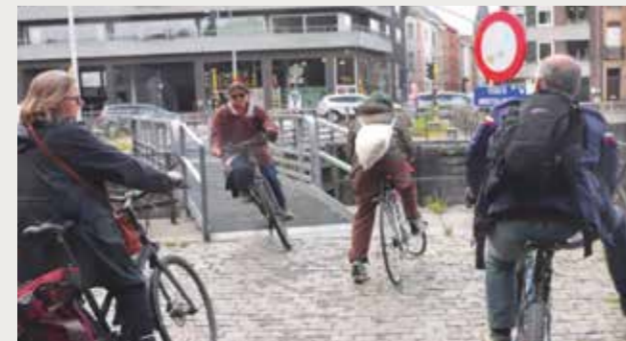
De voormalige smalle doorgang over de roosters van de sluisdeuren

Dankzij de nieuwe brug van BestBridges is er een vlotte en aangename verbinding: perfect voor fietsers, maar ook voor lopers. De vorige passage was niet ideaal als fervente jogger, nu staat niets mijn Strava-record nog in de weg :-). Het meest indrukwekkende voor de bureu in Sint-Amansberg was het feit dat de brug in één nacht werd geplaatst! Een enorme verbetering voor de mobiliteit in de buurt werd in een vingerknip gerealiseerd, straf werk!