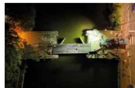
Brug ligt op zijn plaats