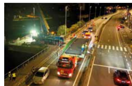
Brug komt via speciaal transport toe op de werf

“In de spits passeren er tot 700 mensen, per dag gaat het over 3.000 gebruikers”